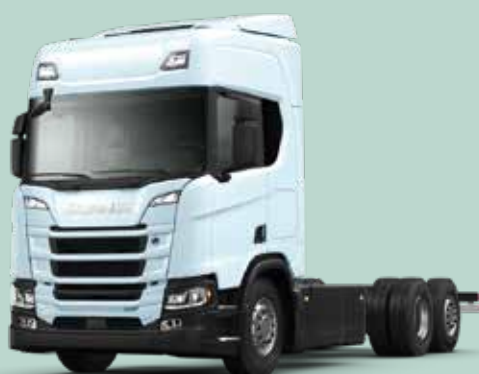
R 360E B6X2*4NB