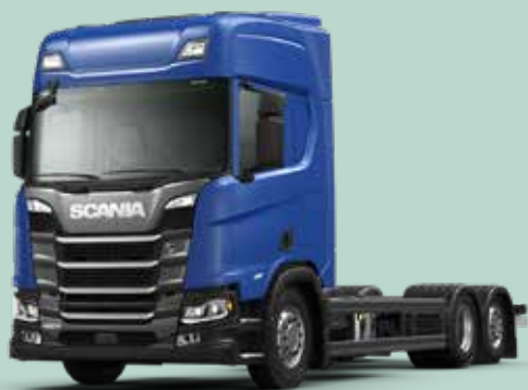
R 460 B6X2*4LB