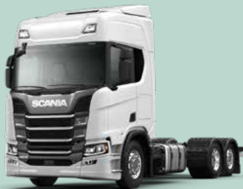
R 460 B6X2*4NB