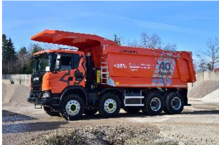
Нова денна G-кабіна, низька

Нова надзвичайно ергономічна денна кабіна серії G має прекрасну шумо- та теплоізоляцію, систему клімат контролю, забезпечує чудову оглядовість, що дозволяє водію безпечно та ефективно працювати протягом зміни. У демо-версії є зовнішня сходи́нка для огляду вантажу та зовнішній речовий відсік.