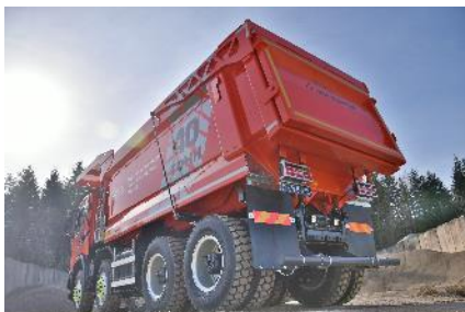
Об'єм кузова 24 куб. м.

Кузов польського виробника КН Кіррег для перевезення скельних порід, руди, розкритих порід. Виготовлений із високоміцної сталі Hardox 450, яка стійка до абразивних та ударних навантажень. Щоб виключити пошкодження кабіни та підвищити безпеку при завантаженні гірських порід, кузов оснащується довгим захисним козирком.