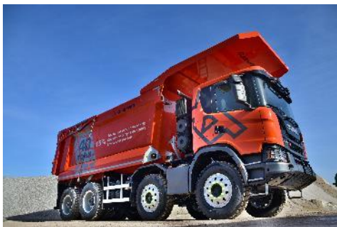
Важкий самоскид Scania G440 8x4 XT підвищеної міцності для роботи в кар'єрах та родовищах

Scania продовжує презентацію нового покоління вантажівок, яке було представлено в Україні минулого року. На черзі продукти та послуги для гірничої промисловості. Scania презентує важкий кар'єрний самоскид Scania G440 8x4 серії Scania XT з міцним брутальним дизайном, зовнішній вигляд і функції якого будуть до вподоби тим клієнтам, які виконують найбільш складні завдання в суворих умовах експлуатації. Презентація відбудеться в рамках виставки Heavy Duty, м. Київ, 19-21 березня та інших маркетингових подій у квітні та травні 2019.