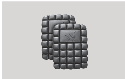
Kelio apsauga minkšta, vidinė 15x20x2 cm