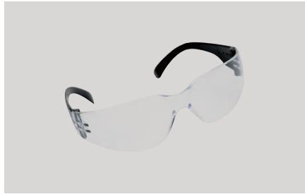
Apsauginiai akiniai patogiai priglundantys, nerasojančios ir atsparūs įbrėžimams, EN166 1F