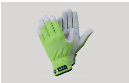
Pirštinės „Tegera 290“ darbui lauke, atsparios drėgmei, pavasariui-rudeniiui