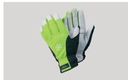
Pirštinės „Tegera 293“ darbui lauke, atsparios drėgmei, žieminės