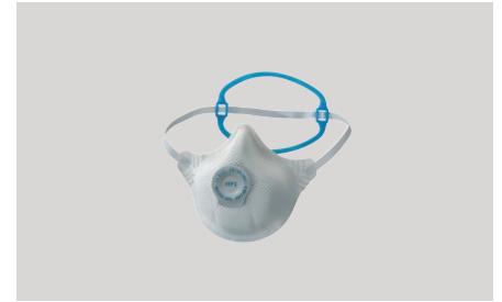
Apsauginė veido kaukė Moldex 2495 FFP2, EN149, universalaus dydžio

Detalės numeris Skaidrūs 2479117 Geltoni 2479118 Pilki 2479119