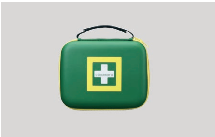
Pirmosios pagalbos rinkinys "Cederroth", vidutinis