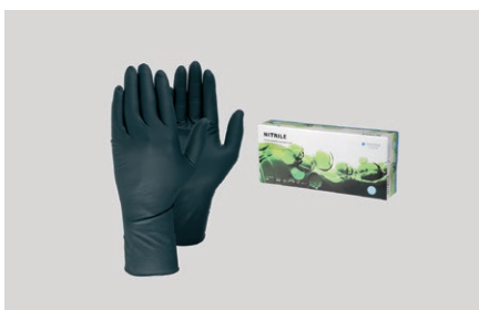
Pirštinės „Tegera 849“ vienkartinės, ilgos, III kat. nitrilas, pakuotėje 50 vnt.