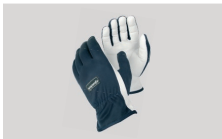
Pirštinės „Tegera 124“ surinkimo ir montažo darbams sausoje aplinkoje (ožkos oda, nailonas)