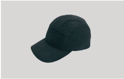
Apsauginė kepurė reguliuojamo dydžio