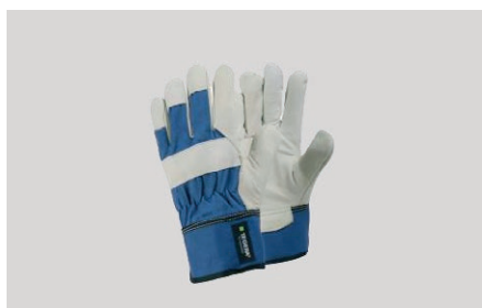
Pirštinės „Tegera“ darbui su sunkiais ir šiurkščiais paviršiais, sutvirtintos