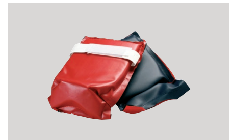
Kelio apsauga išorinė