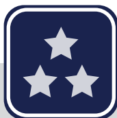
CONTRATO M PLUS

Es un plan de mantenimiento preventivo con tarifa plana realizado a la medida de su vehículo y su negocio. Incluye las revisiones periódicas y mantenimiento preventivo con repuestos legítimos Scania y garantía en todo el país.