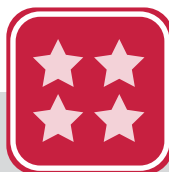
CONTRATO M PLUS PREMIUM

Esta modalidad de contrato también es con tarifa plana.